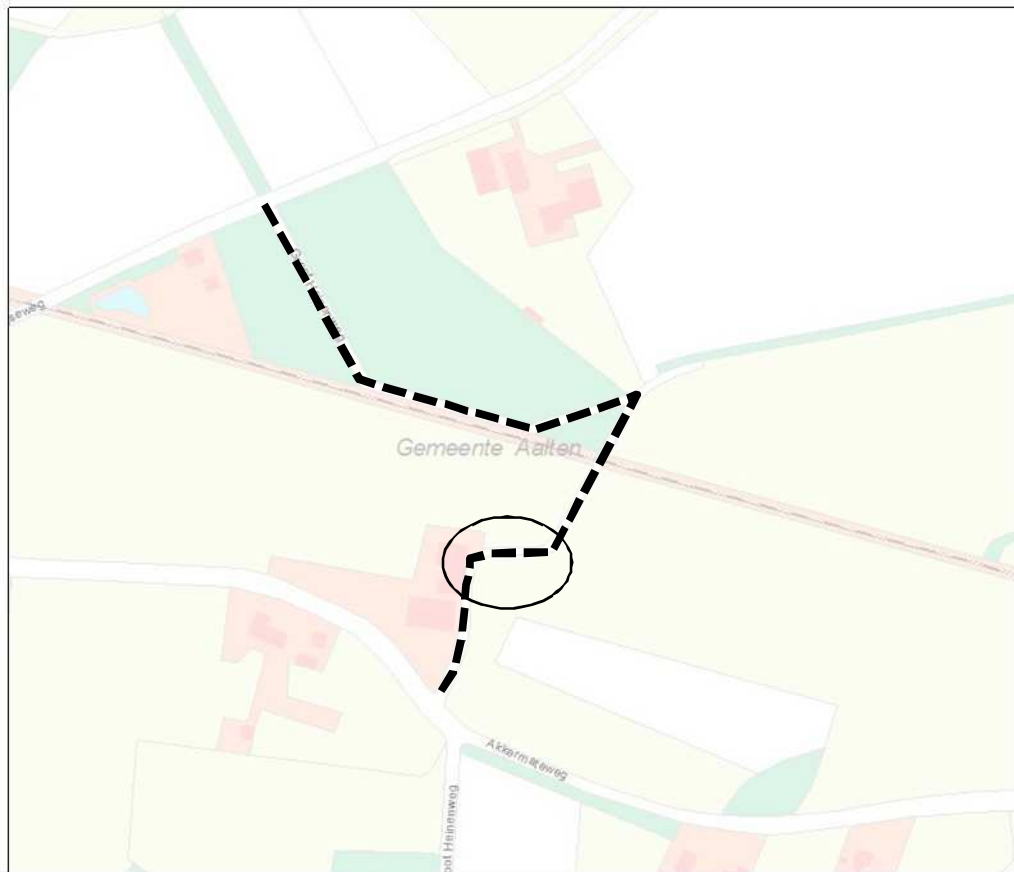
Ligging van het tracé 'groot Heinenweg'