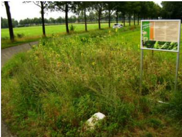
Akkerrand met informatiepaneel.

Het akkerrandenproject 2014 is een voortzetting van een project dat al enkele jaren loopt en is gestart door de Gebiedscommissie Aalten. Langs agrarische percelen, overhoekjes en wegbermen wordt een bloemrijk kruidenmengsel ingezaaid. Deze randen dragen bij aan een visueel aantrekkelijker landschap en versterken de ecologische kwaliteit vanwege de toename aan nectarplanten (o.a. goed voor bijen). Er wordt jaarlijks een fietstocht georganiseerd door de VVV-Aalten langs de bloeiende akkerranden. Verschil met het Patrijzenproject is dat deze akkerranden ook buiten het verspreidingsgebied van de Patrijzen worden aangelegd en op plekken die niet bijzonder geschikt (winter)habitat voor Patrijzen zijn zoals wegbermen.