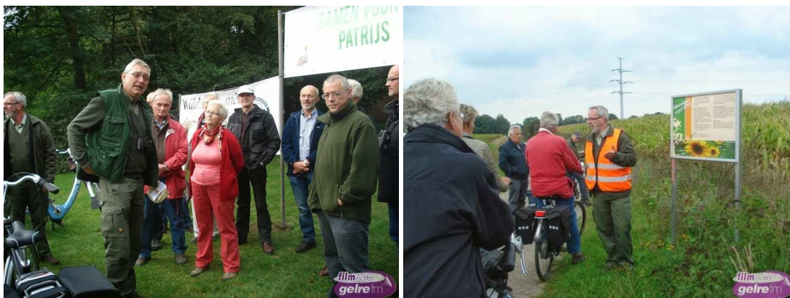
Voorlichting aan geïnteresseerden over het Patrijzenproject tijdens een van de fietstochten.

Met de gevraagde bijdrage wordt zaaigoed aangeschaft en krijgen deelnemers een kleine vergoeding voor het niet in gebruik nemen van agrarische stukken land.