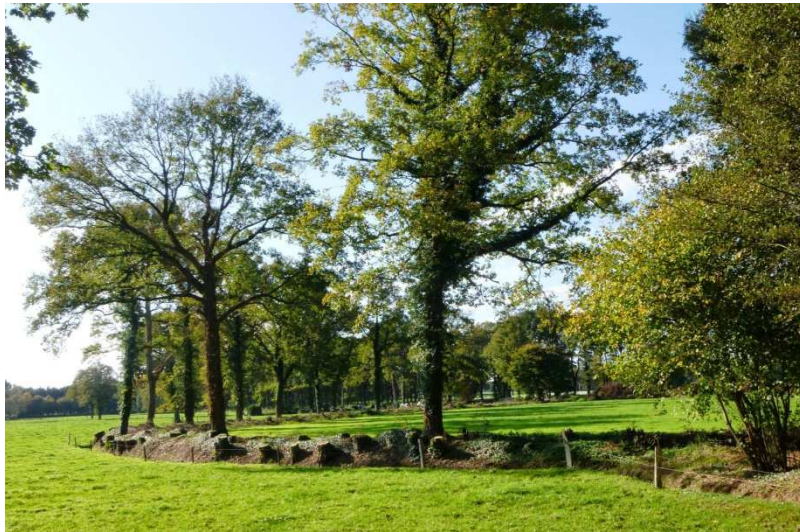
Recent afgezette en uitgerasterde houtsingel in Winterswijk.